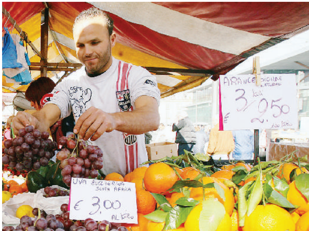
Guardati con diffidenza, gli stranieri potrebbero diventare indispensabili alle prossime amministrative